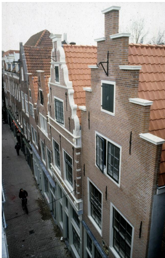
Sint Annenstraat 10,12, 14 en 16 in Amsterdam voor en na restauratie.