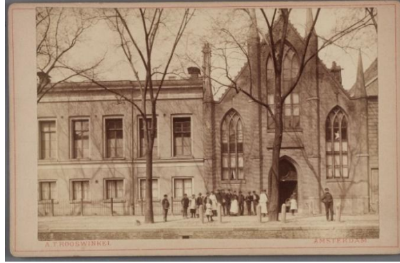
Christ Church in Amsterdam