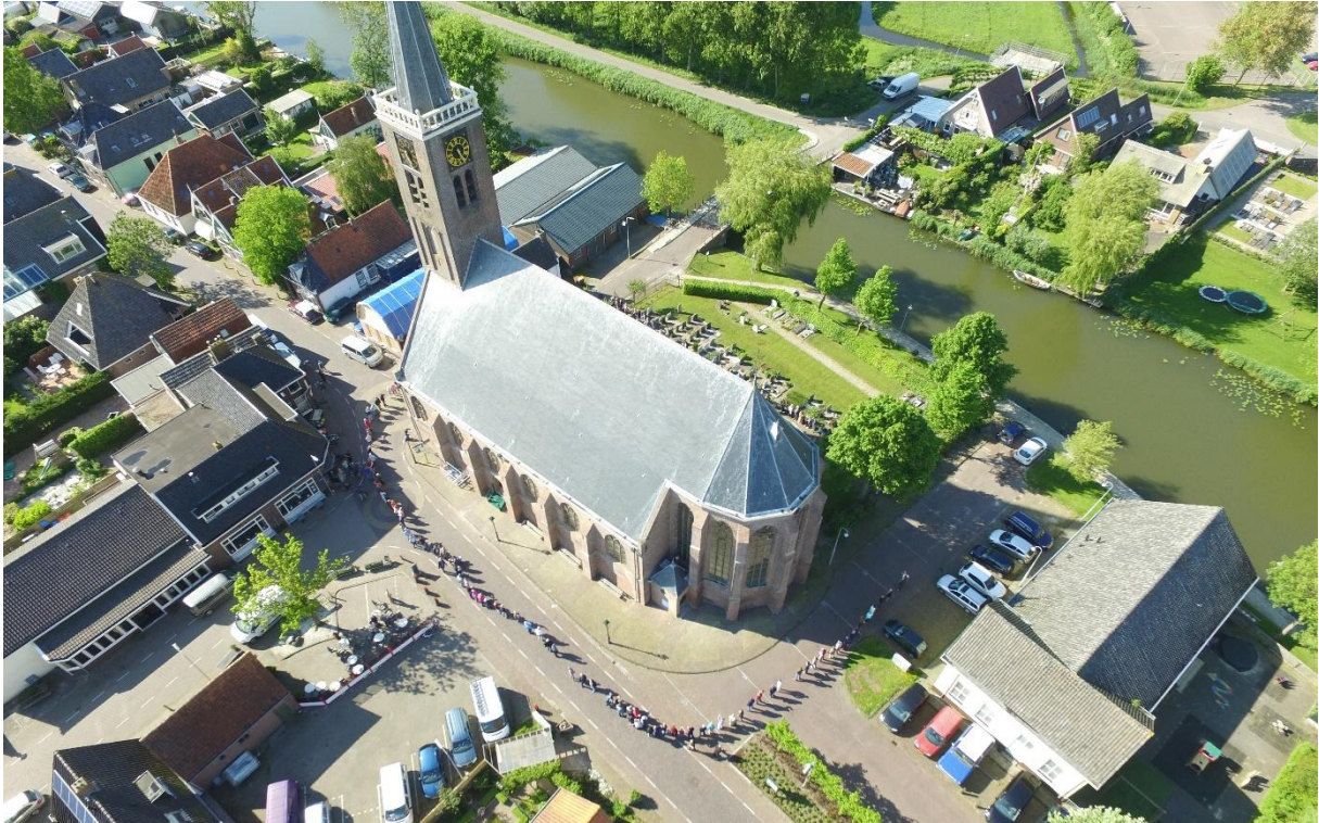
De Grote kerk in Schermerhorn wordt hier omarmd door het dorp. Vrijwilligers verzorgen de zaalverhuur en organiseren culturele activiteiten zoals de dorpsmaaltijd. De Vrienden droegen bij aan de restauratie van het glas-in-lood.