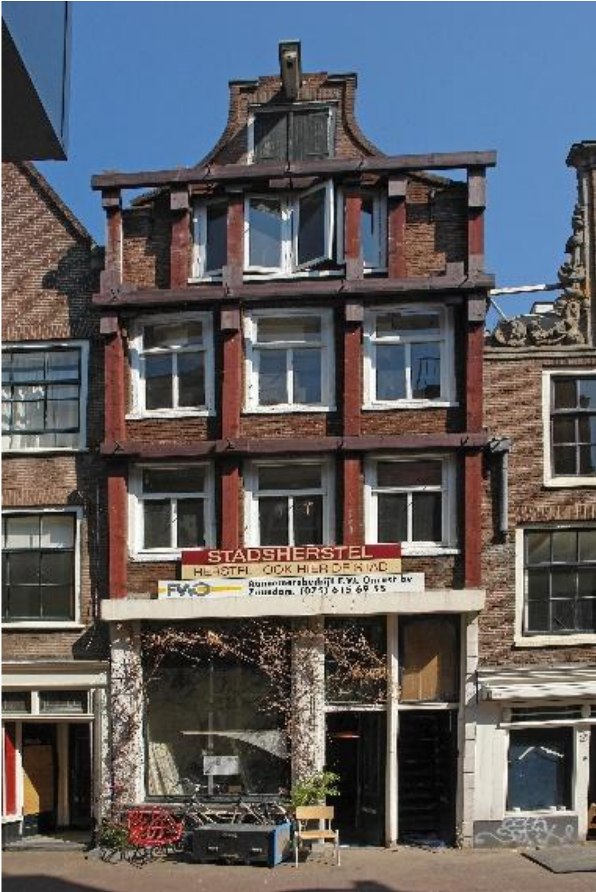
Runstraat 4, Amsterdam voor restauratie