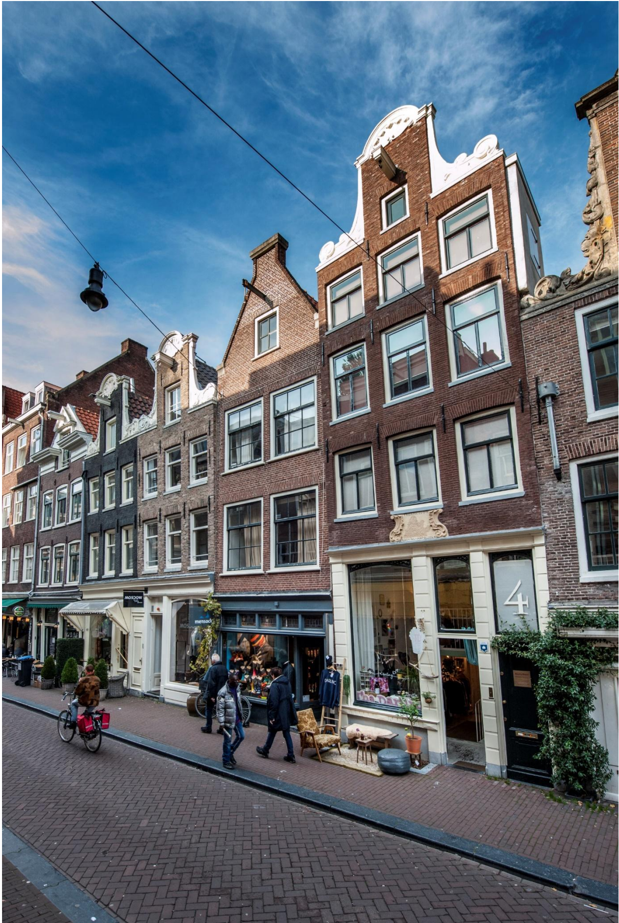
Runstraat 4, Amsterdam na restauratie met een oude top van de monumentenwerf