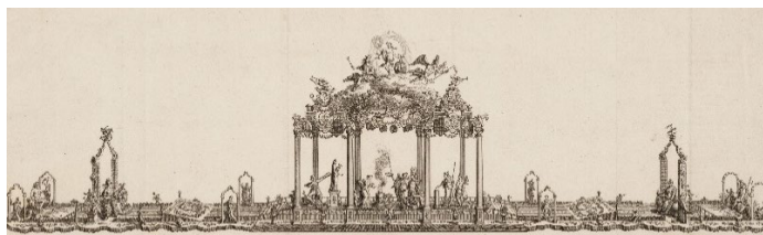
Suikerwerk bij de Gouden Bruiloft