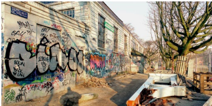
Amstelkerk voor restauratie in 1989