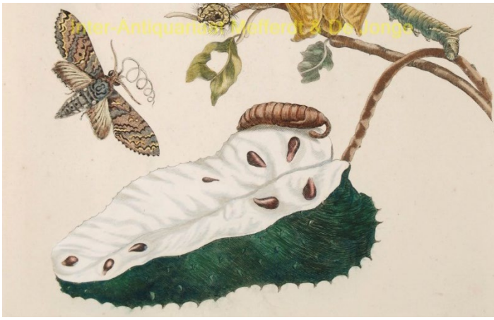
Zuurzak door Maria Sibylla Merian, het vruchtvlees kan als moes of siroop dienen.