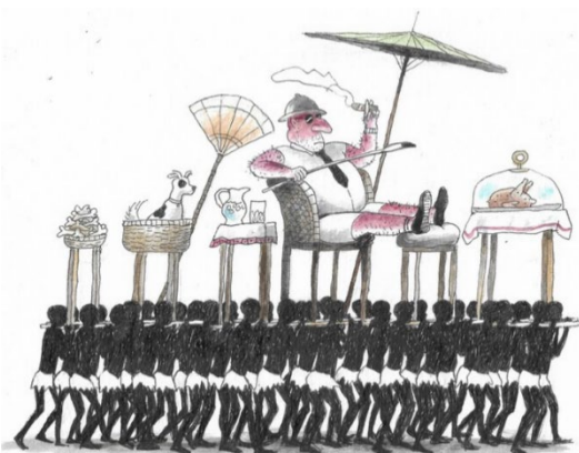
Tekening van Thé Tjong-Khing rond het thema kolonialisme

Khing tekende strips totdat hij, juist omdat hij striptekenaar was, in 1970 door kinderboekenschrijfster Miep Diekmann wordt gevraagd illustraties te maken bij haar boek 'Total loss, weetjewel!'. Thé wint o.a. drie keer het Gouden Penneel.