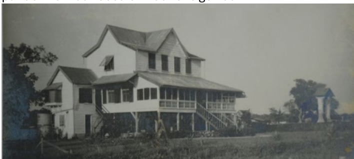
De directeurswoning van plantage Berlijn