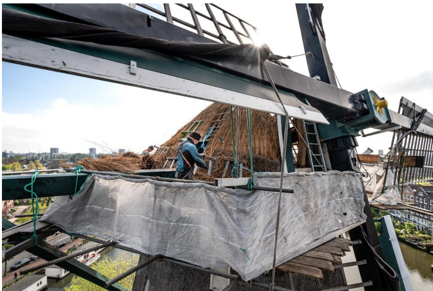
Onderhoudt aan Molen de Gooyer. De Vrienden droegen bij

Voor-, tijdens en na de restauratie van een monument worden de Vrienden en vaak ook andere geïnteresseerden uitgenodigd om een kijkje te nemen bij een project. Ook wordt de geschiedenis van het pand en de restauratie via diverse communicatie uitingen gedeeld. Zo blijft het publiek betrokken bij erfgoed en blijft er draagvlak voor behoud. Belangrijk is, dat iedereen van erfgoed kan genieten. Daarom worden er ook diverse gratis activiteiten georganiseerd. Door het organiseren van onder meer laagdrempelige culturele activiteiten worden ook culturele aspecten onder de aandacht gebracht. De openstelling van kerken maar ook andere gebouwen wordt mogelijk gemaakt door een grote groep zeer betrokken vrijwilligers.